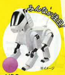
AIBO イヌ型ロボット。定価25万円にもかかわらず、販売開始から20分で日本向け3000台が売れた。