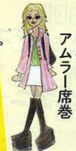
私服 アムラー 席巻

安室奈美恵を真似る「アムラー」が急増。厚底ブーツとプラダのリュックなどで背伸び。