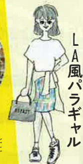
私服 L.A.風パラギャル

クレーンで景品を獲得。デートのときは、景品のぬいぐるみを彼女にプレゼント。狩猟民族化。